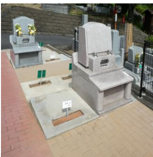
期間限定区画変更区画

長年ご利用いただいているお客様で墓所の移動をご希望の場合、園内の他の墓所への区画変更が可能です。詳しくは管理事務所までご相談ください。